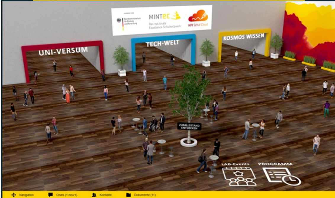
Autores: Doménica Hadweh, María Caiza